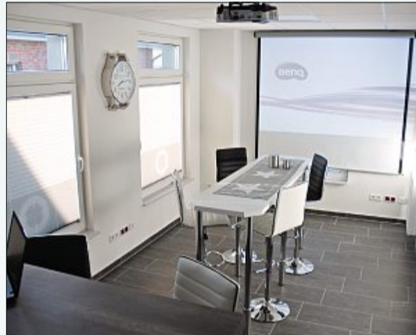
Der moderne Aufenthaltsraum mit Beamer-Technik.

raum mit Beamer Technik geschult. Arbeitsabläufe werden immer wieder hinterfragt, um durch geistige Flexibilität das beste Ergebnis zu erzielen. „Mit dem Neustart im Gewerbegebiet können auch die Marketingmaßnahmen im Nordwesten ausgebaut werden“, so Kleemann. Bislang war die Kleemann GmbH ein Streckenhändler mit guten Kontakten zu verschiedenen Edelstahl-Servicecentern und Edelstahl-Produzenten. Das Material wurde von dort aus in großen Losen direkt zum Kunden gebracht.