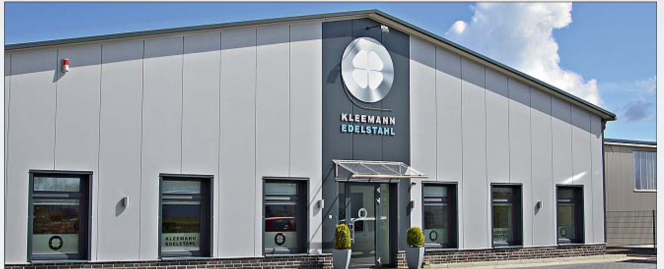
Die neue Lagerhalle im Gewerbegebiet von Schwittersum. Mehrere 100 Tonnen Edelstahl können hier gelagert werden. Auch Privatkunden können hier ihren Edelstahl beziehen. Um vorherige Anfrage wird gebeten.