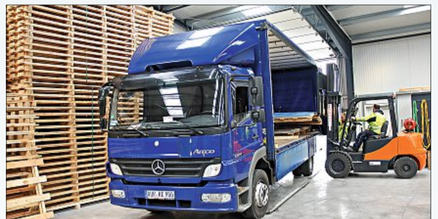
In den neuen Fuhrpark soll investiert werden. Die Lastwagen können in die Halle fahren, um das Material witterungsunabhängig verladen zu können.

und sichere Ent- und Beladung garantiert. Der Lagerboden ist für Schwerlast geeignet und wuppt 24 Tonnen pro Quadratmeter. Das Areal umfasst 7000 Quadratmeter Fläche, wobei die Außenfläche noch gepflastert werden soll. Auch ein weiterer Anbau sei geplant. • Fortsetzung auf Seite 19